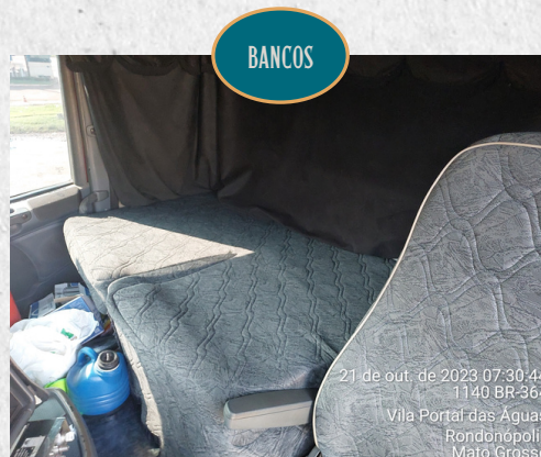
Foto de cima do banco