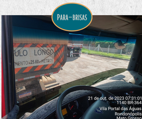
FOTO DO PAINEL LIGADO