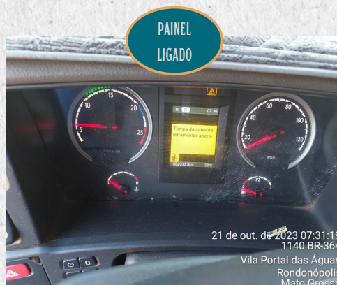
Foto do painel com a chave ligada