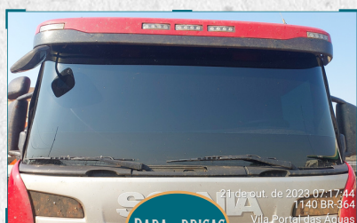
Foto do Para-brisas inteiro