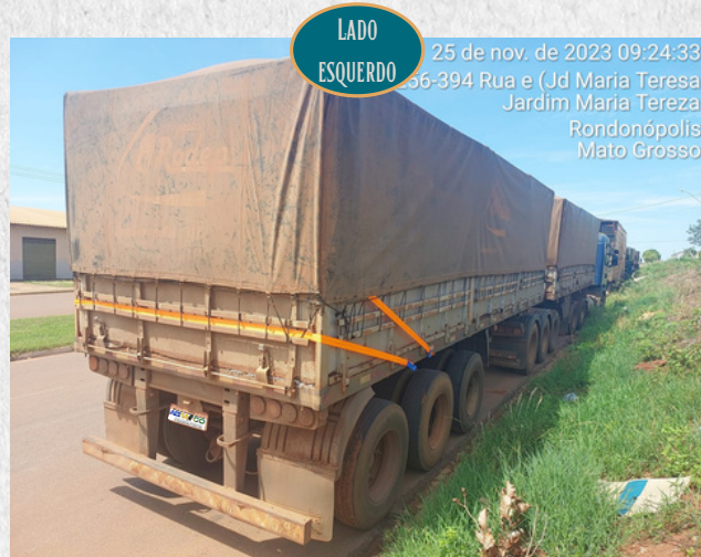
Foto pegando a lateral esquerda da carreta