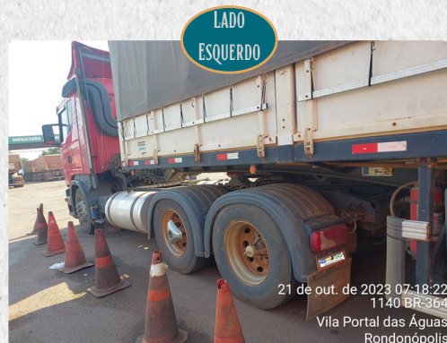
Foto da Lateral Esquerda Pegando a Traseira e a Cabine do Veículo