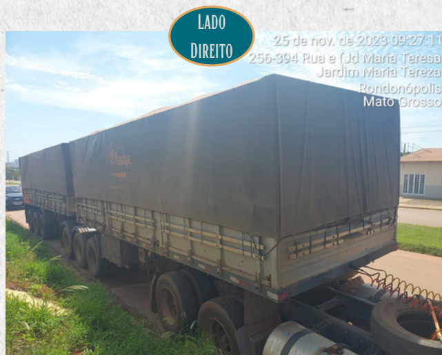
Foto na diagonal pegando a lateral direita da carreta