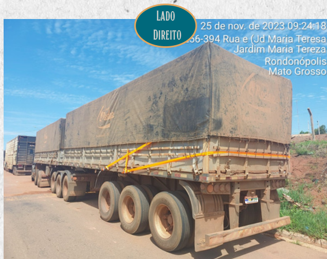
Foto pegando a lateral direita da carreta