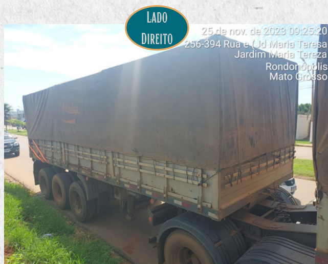
Foto na diagonal pegando a lateral direita da carreta