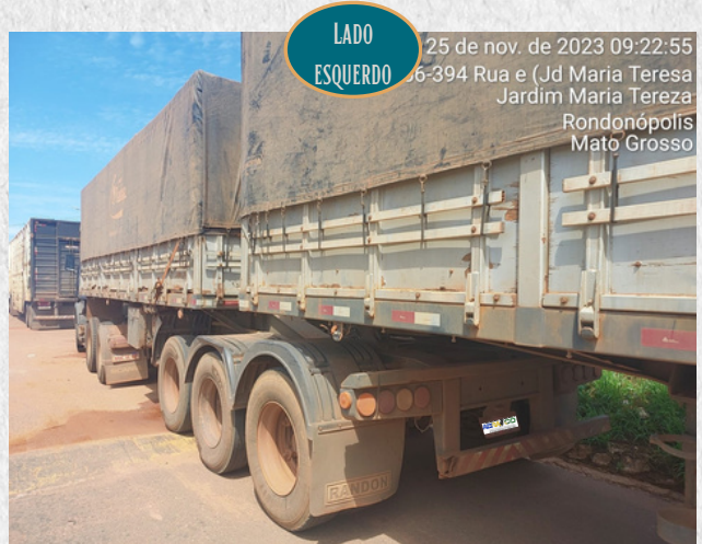
Foto pegando a lateral esquerda da carreta