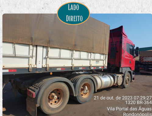
Foto da Lateral Direita Pegando a Traseira e a Cabine do Veículo