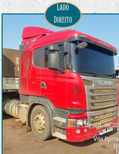
Foto na diagonal pegando a lateral direita do veículo