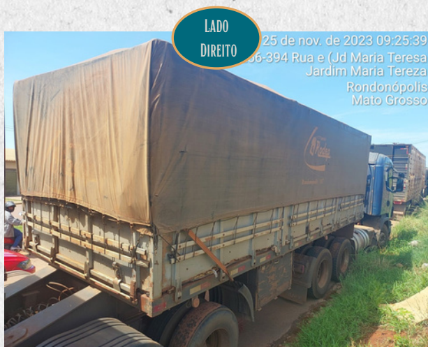
Foto pegando a lateral direita da carreta